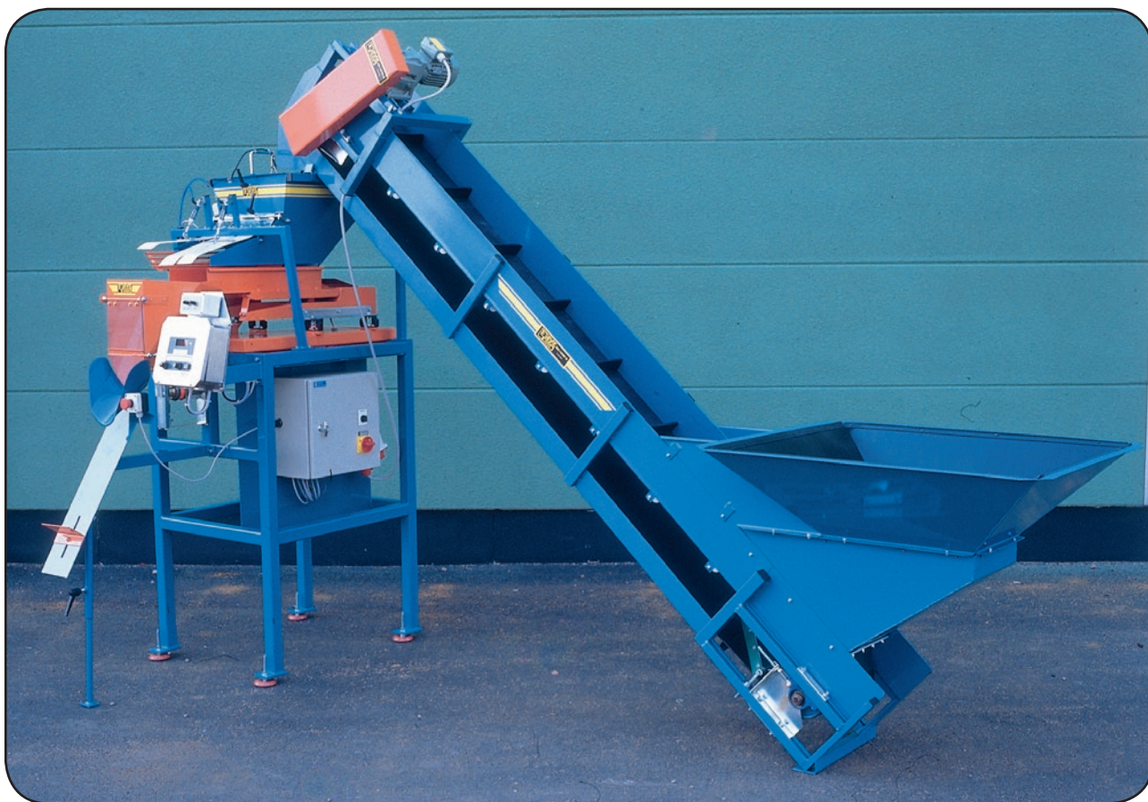
Paketeringsmaskin W-5 med enkel vågskål

För uppvägning av potatis, lök etc i satser om 0,5-5 kg.