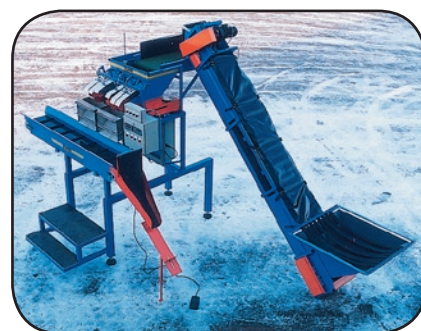
Paketeringsmaskin Wx2-5 med transportör under vågarna.

vibrationer, samt pneumatiska spjäll ger noggrann och snabb uppvägning till förvald satsvikt. Justerbart påsstöd för inställning av önskad arbetsställning.